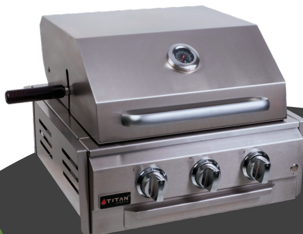
HOME PRO 3