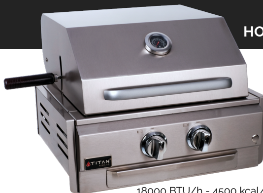
HOME PRO 2